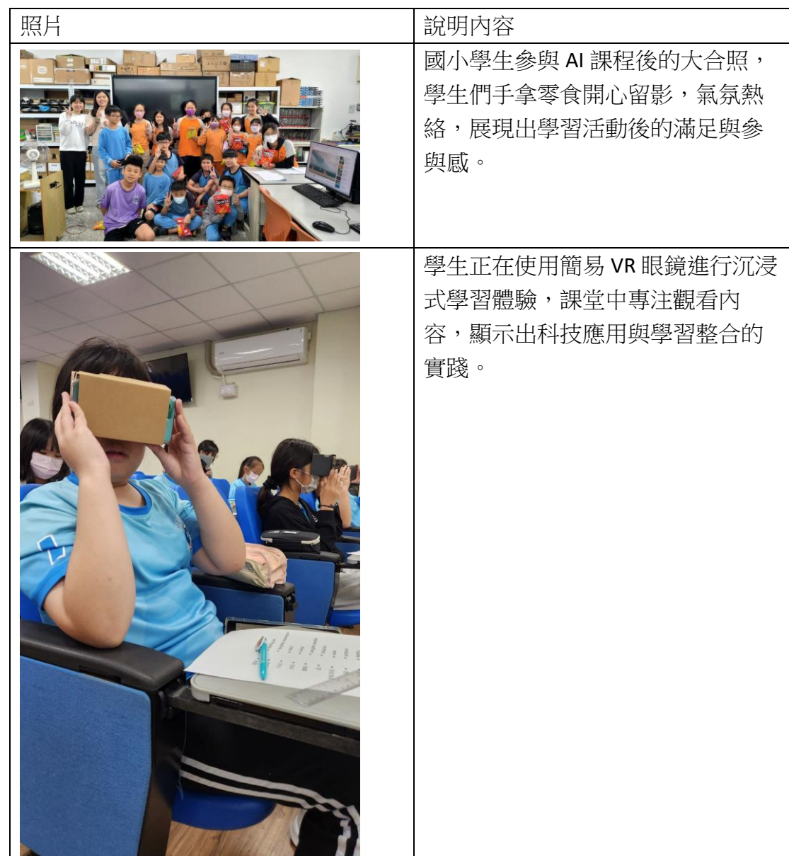
附件一：AI 教學活動照片與說明對照表